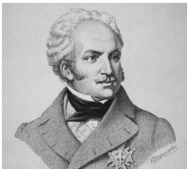
Karl Wilhelm Naundorff

'Naundorff, het mysterie van het Kalverbos' is een initiatief van de Stichting Zangstudio en werd mede mogelijk gemaakt met een donatie uit het Delfia Batavorumfonds.