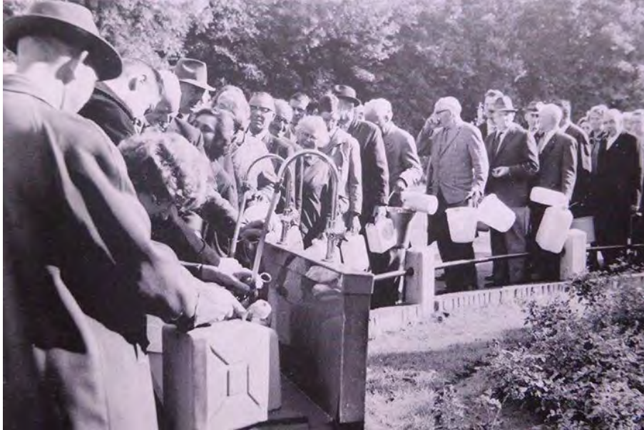
Delftenaren halen in 1963-1964 drinkwater bij Shell aan de Broekmolenweg

Delfia Batavorum bestaat 80 jaar en viert dat onder meer met speciale lezingen over onderwerpen uit de Canon van Delft, belicht vanuit de geschiedenis, het heden en de toekomst. Op 27 oktober hoort u drie verhalen over schoon drinkwater in Delft.