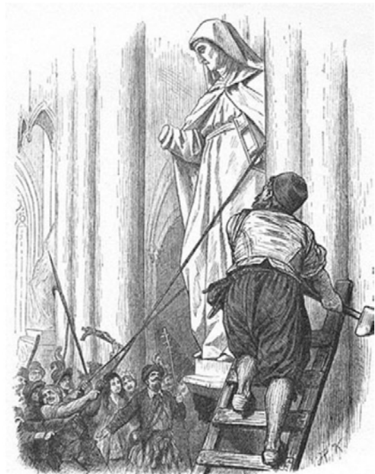
Beeldenstormers aan het werk (F. de Witt-Huberts. Het beleg van Haarlem, Haarlems heldenstrijd in beeld en woord 1572, Haarlem 1944)

Ook in Delft liepen de spanningen hoog op gedurende de zomer van 1566. Al in juni deed Aelbrecht van den Houff, een afvallige pastoor uit Scheveningen, tot tweemaal toe een poging om in Delft te preken. Op 25 en 26 augustus 1566 was het raak in de stad. De interieurs van zowel de Oude, als de Nieuwe Kerk moesten het ontgelden. Ook de Delftse kloosters werden niet overgeslagen door de beeldenstormers. In de overgeleverde archiefstukken lezen we bijvoorbeeld hoe Hendrick in de Prins de deur van het minderbroederklooster verwoestte