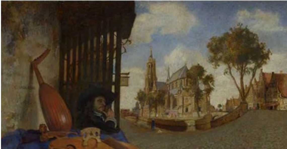
Carel Fabritius, Gezicht in Delft, 1652

seerd in het geven van lezingen waarin beeldende kunst gecombineerd wordt met klassieke muziek. Zij geeft op uitnodiging lezingen in musea, bij kunstkringen en andere gezelschappen. Voor meer informatie zie www.imagomusica.nl