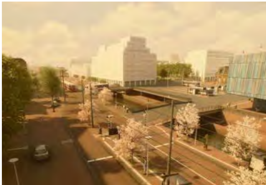
Westvest ter hoogte van het station

Het zijspoor is speciaal bedoeld voor lijn 19 (Randstad Rail) tussen Leidschendam en Delft. Behalve tram 1 gaat straks ook tramlijn 19 over de Westvest en vervolgens via de Zuidwal naar de TU-wijk. Daar is al ruim baan gemaakt voor de tram en daar liggen ook al rails. Maar doorrijden kan pas, als de Sebastiaansbrug klaar is. Dat zal op zijn vroegst pas in 2020 zijn, zo hopen de gemeente Delft, de provincie Zuid-Holland en de Metropoolregio “op basis van een eerste verkenning”. Niettemin is er nu al een vergunning aangevraagd om de tailtrack te mogen neerleggen. Waarom tram 19 een eindhalte nodig heeft bij het station, dat is nog weer een heel andere vraag. Er is sinds 2014 een gloednieuwe tailtrack bij het Kalverbos, het huidige eindpunt van lijn 19. Ook daar zie je drie tramsporen naast elkaar liggen met een wachtende tram.