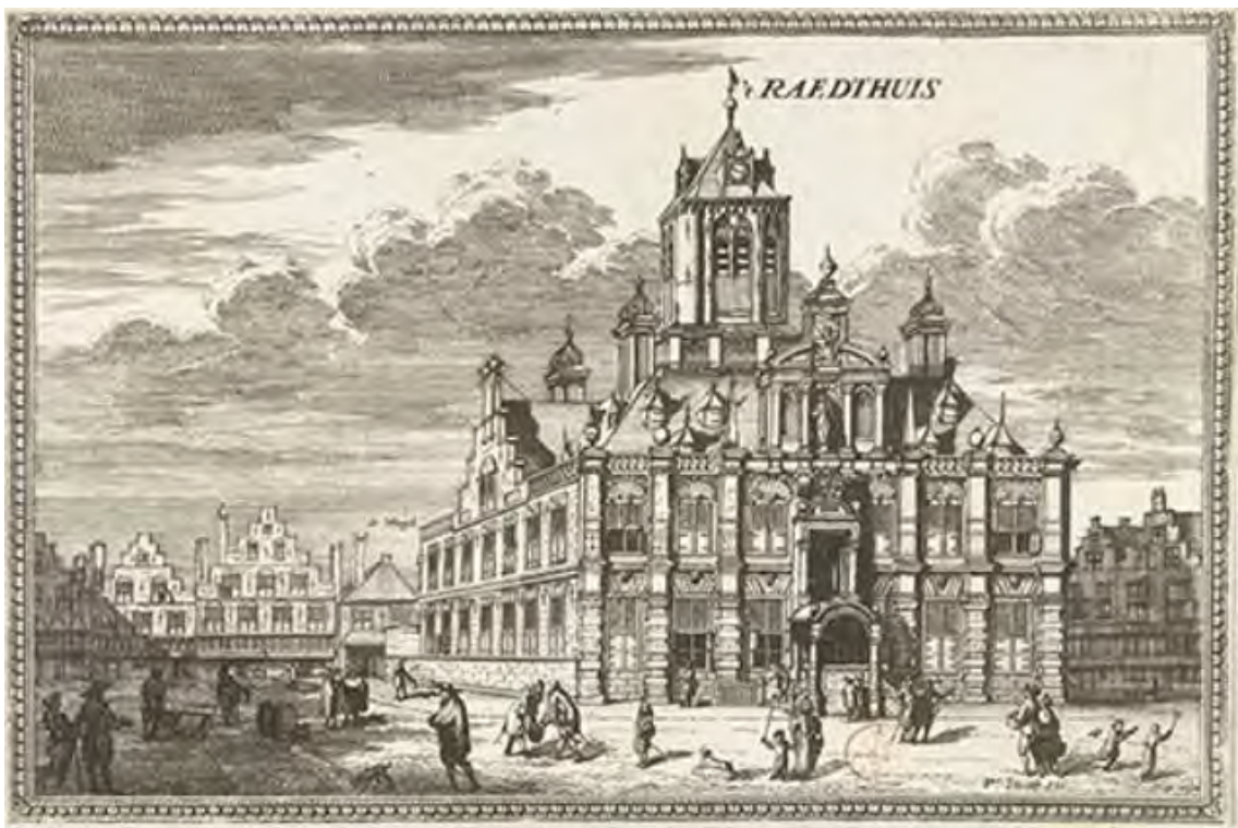
Het stadhuis in de stadsbeschrijving van Dirck van Bleyswijck uit 1667