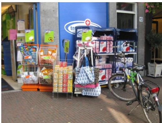
Uitstallingen aan de Choorstraat

We maken een denkbeeldige wandeling dwars door de stad. Waar 'struikelen' we over? De foto's, die we hebben gemaakt zijn een illustratie, een momentopname. Morgen kan het weer anders zijn. Die 'tijdelijkheid' is trouwens een deel van het dilemma: moeten we ook op de barricades als het probleem volgende week weer is opgelost? Als een horecaondernemer een leuk hoekje voor spelende kleuters heeft ingericht? Als de terrasstoelenmode knalgeel voorschrijft, moeten wij dan zo 'ouderwets' zijn om dat niet te willen. Hieronder een aantal voorbeelden en overwegingen.