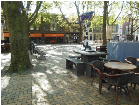
Beestenmarkt in het winterseizoen

Op het Doelenplein wisselen horecaondernemers voor het café onder het appartementencomplex elkaar in hoog tempo af. Elke nieuweiling probeert iets leuks voor zijn terras te verzinnen. In dit geval pakweg acht plekken voor houtopslag met Bavaria-fietsenrekken er tussen. Een omheind terras dus. Zou er iemand ooit een blik in het Uitvoeringsbeleid Terrassen hebben geworpen? Onwaarschijnlijk.