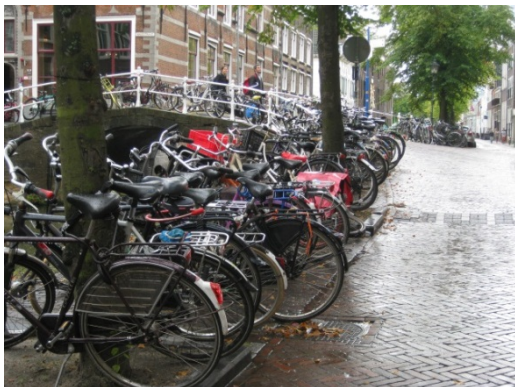
Fietsen bij een studentensociëteit aan de Oude Delft: mooi is anders.

De kwaliteit van de binnenstad is weer een heel ander verhaal. Bijvoorbeeld: kunnen terrasstoeltjes zomaar een brug in beslag nemen en daarmee voor andere mensen dan de koffie- en bierklanten het uitzicht op de gracht belemmeren? Moet je het openbaar gebied, zoals achter het stadhuis op de Markt, zo volbouwen met terras, dat je er nauwelijks nog langs kan? Elke horeca-uitbater zou het gemeentelijk terrasbeleid uit zijn hoofd moeten kennen. Maar iedereen heeft ook zo zijn eigen ideeën over hoe hij kan bijdragen aan het mooi houden van de stad. En uiteraard gaat het ook om het geld: als een terras kleiner wordt, dan kost dat geld, en wie wil dat nou: inkomsten inleveren?