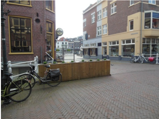
Van Voldersgracht naar De Markt