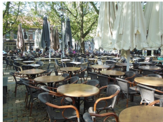
En zo is het in de zomer op de Beestenmarkt

Ook in de winter staan hier terrassen. In de winter kun je er makkelijk langs om het plein over te steken. In de zomer wordt het hier in een massale opslagplaats voor stoelen. Mooi? Lastig oversteken.