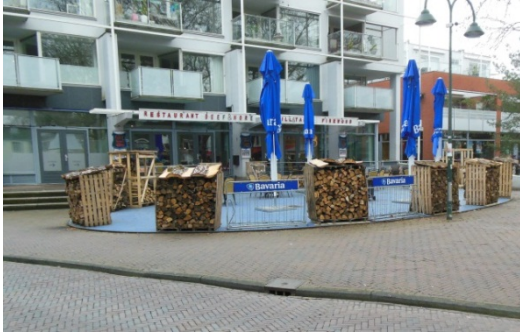
Terras aan het Doelenplein