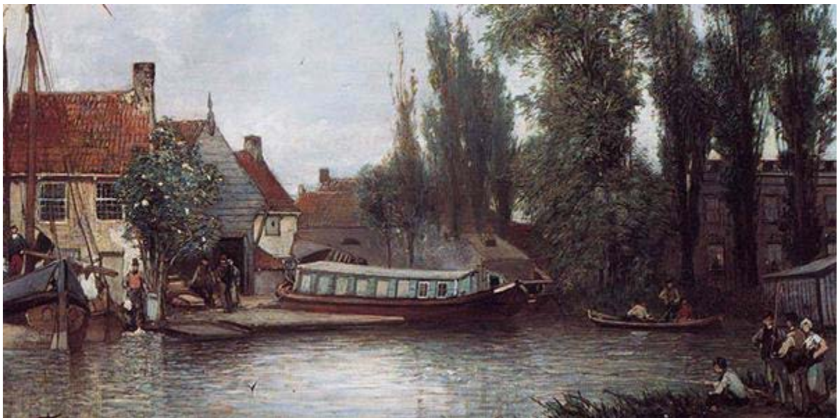
J.B. Jongkind 1856. Een scheepmakerij aan de Schie bij Delft met een trekschuit in onderhoud.