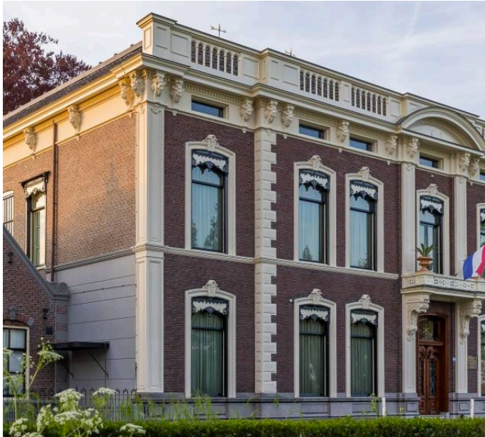
Museum Paulina Bisdom van Vliet in Haastrecht