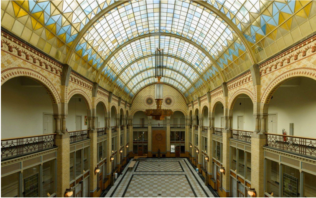
De hal van het voormalige hoofdkantoor van de Gistfabriek