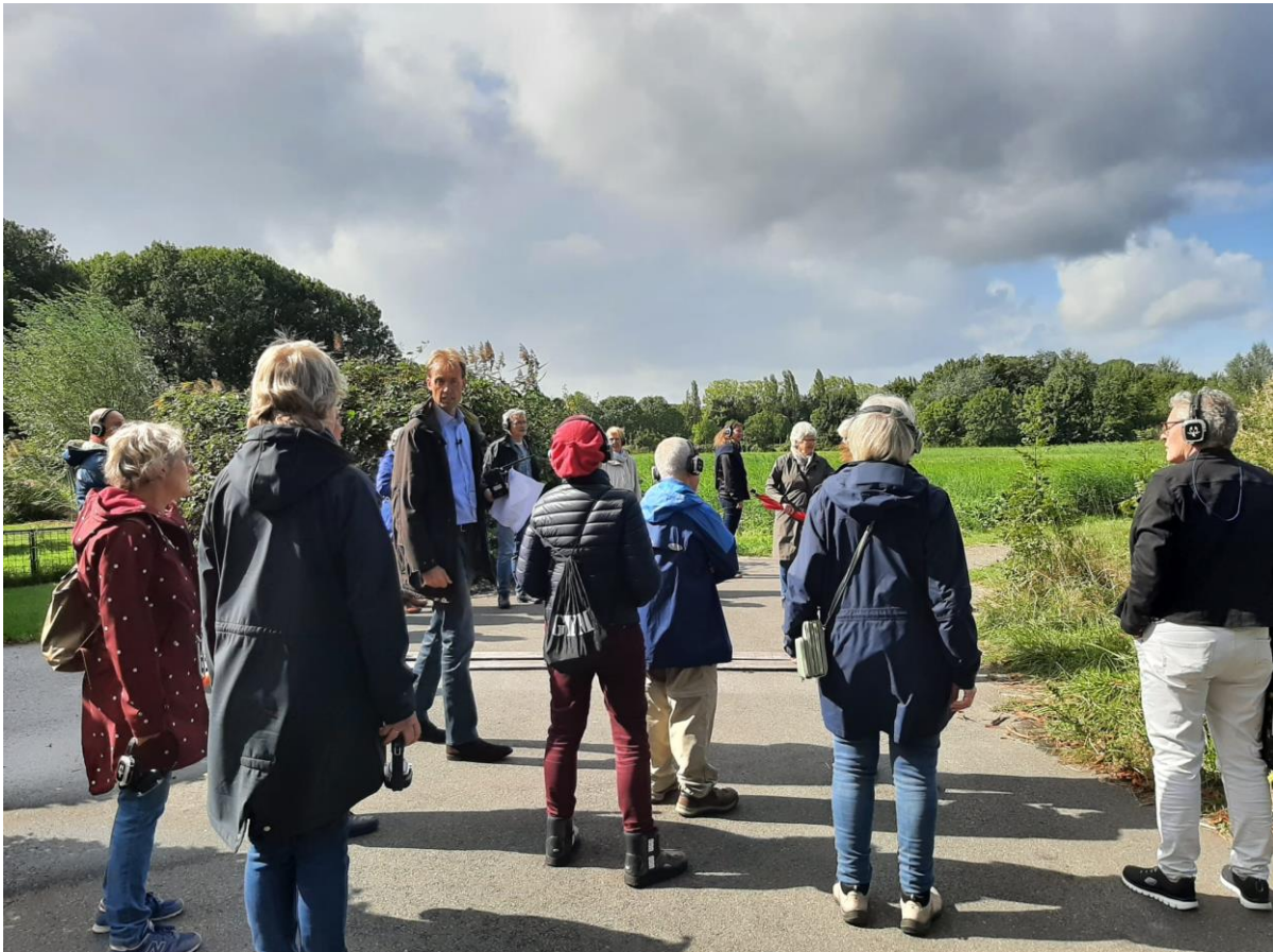
Excursie naar Pasgeld/'t Haantje