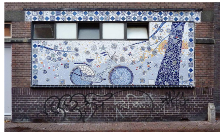
Winnaar Le Comteprijs Delfia Batavorum