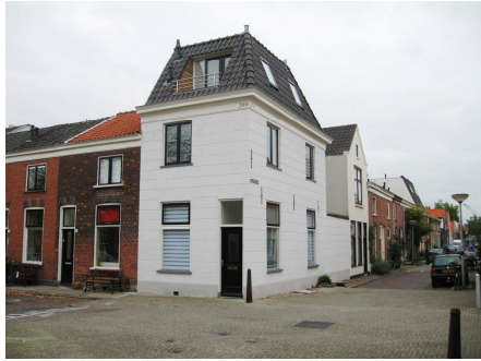
Winnaar Publieksprijs Delft op Zondag

De winnaars ontvingen het Delftsblauwe bord van de Porceleyne Fles en alle genomineerden kregen een oorkonde en bloemenhulde. Ook bij de stemming in Delft op Zondag gooiden de kunstwerken in de Pluympot hoge ogen, maar de winnaar werd het hoekpand aan de Van Bleyswijkstraat.