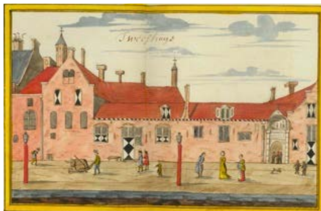
Het Weeshuis aan de Oude Delft, getekend naar een prent door Abraham Rademaker, circa 1730

halfwezen, soms honderden tegelijk. Toen de behoefte aan institutionele weezorg in de twintigste eeuw verminderde, heeft het Weeshuis zich enige tijd gericht op de huisvesting van werkende jongens. De laatste decennia bestond het alleen nog als een relatief klein fonds voor steun aan het jeugdwerk in Delft.