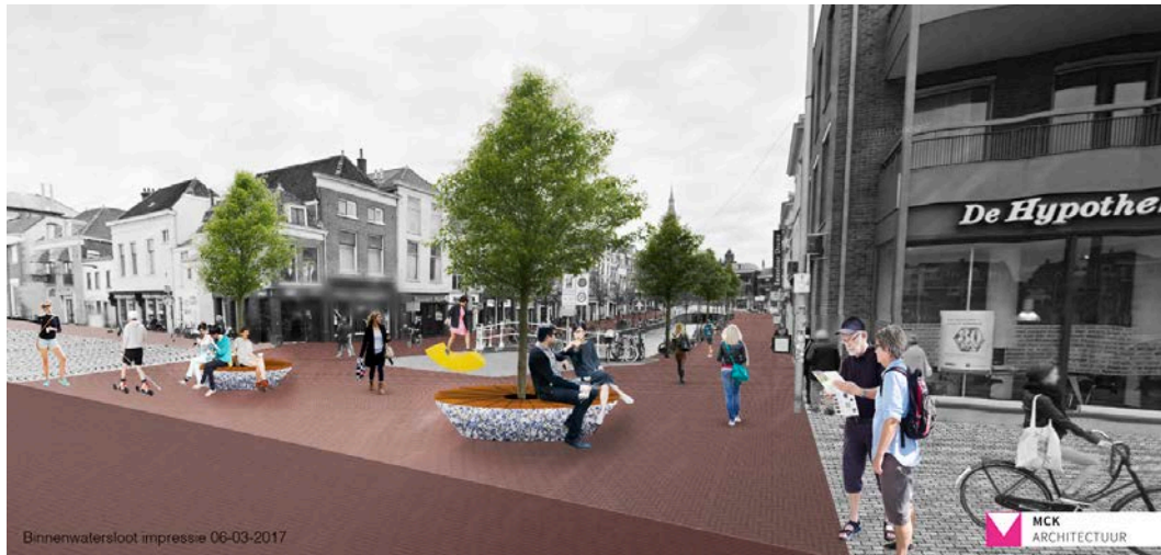
Voorstel voor herinrichting van de Binnenwatersloot

Hetzelfde – een afsluiting – lijkt nu te gebeuren bij de Binnenwatersloot. De architect die voor het plan is ingeschakeld, ziet grote terrassen op hoeken van straten voor zich. Maar de stadsbouwmeester heeft al gezegd dat fietsers er een eigen strook moeten krijgen. De wethouder heeft gezegd dat Oude Delft en Koornmarkt bereikbaar moeten blijven voor bevoorraders en bewoners, ook per auto, desnoods met een ontheffing. En het Bestemmingsplan Binnenstad 2012 bepaalt dat de Binnenwatersloot een 'aanlooproute' is, richting centrumwinkelgebied. Daarmee is deze gracht geen 'verblijfsgebied'.