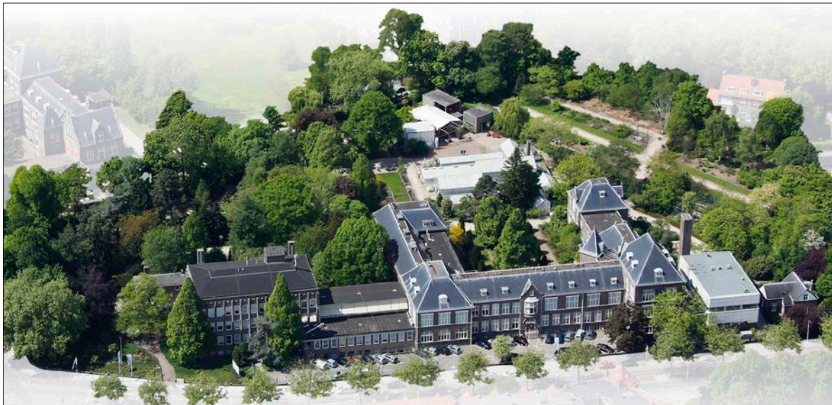
Luchtfoto van het gebied van de Botanische Tuin van de TU Delft

Onder de intrigerende titel 'Het Groene Laboratorium' vertelt Trudy van der Wees op 21 september over de Botanische Tuin in Delft, die dit jaar 100 jaar bestaat en waarover zij een jubileumboek schreef. Van oorsprong heette de tuin Cultuurtuin voor Technische Gewassen. Deze ontwikkelde zich van een tuin waarin industriële toepassingen van plantaardige materialen werden ontwikkeld, tot een groen laboratorium waarin innovatieve en duurzame oplossingen worden bedacht voor maatschappelijke problemen zoals de bestrijding van fijnstof of de rol van planten in dijkverzwaring.