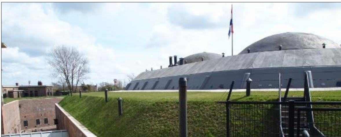
Het fort 1881 met geschutskoepels

Het historische pantserfort is in 1881 gebouwd ter verdediging van de ingang van de Nieuwe Waterweg en de haven van Rotterdam. Er werd een fort ontworpen met zwaar kustgeschut, waarvoor in 1881 de eerste paal werd geslagen in de duinen langs de Nieuwe Waterweg. Men groef een grote diepe kuil, waarin het eigenlijke Fort werd gemetseld. Men gebruikte voor die tijd de modernste technieken. In 1889 werden de drie koepels met kanonnen geplaatst, waarna op 1 september 1889 het fort officieel door het leger in gebruik werd genomen.