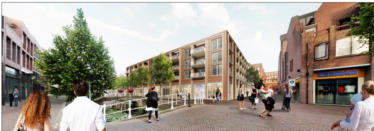
Het ontwerp van Atelier Pro Architecten voor de V&D-locatie

Wij willen natuurlijk allemaal dat de historische binnenstad haar kwaliteit behoudt. Maar wat is dan die kwaliteit? Het zijn de grachten met de bomen en de bijzondere gevelwanden met dwars daarop de stegen, die het beeld bepalen. De gevels van de grachten en de stegen bestaan uit veel verschillende woningen, prachtig in de rooilijn, mooi gedetailleerd, met hier en daar een uitzondering. Bijvoorbeeld een groter gebouw, met een bijzondere functie of een accent van een erker met een balkon.