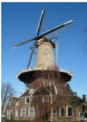
Molen de Roos met het molenaarshuis

Spreker: Aart Struijk Datum: donderdag 30 oktober 2014 Tijd: 20:00 uur Plaats: De VAK, Westvest 9 Toegang: leden Delfia Batavorum gratis; niet-leden € 5,-. Aanmelden is niet nodig.