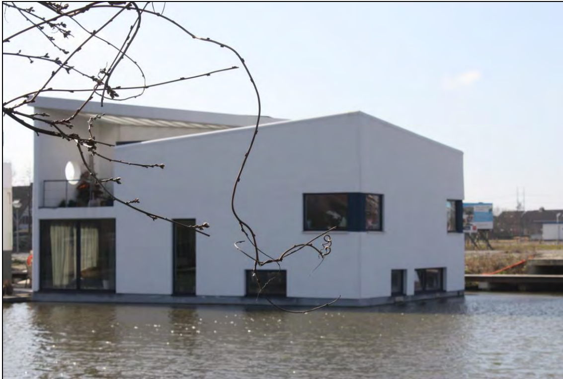
Waterwoning in de Harnaschpolder