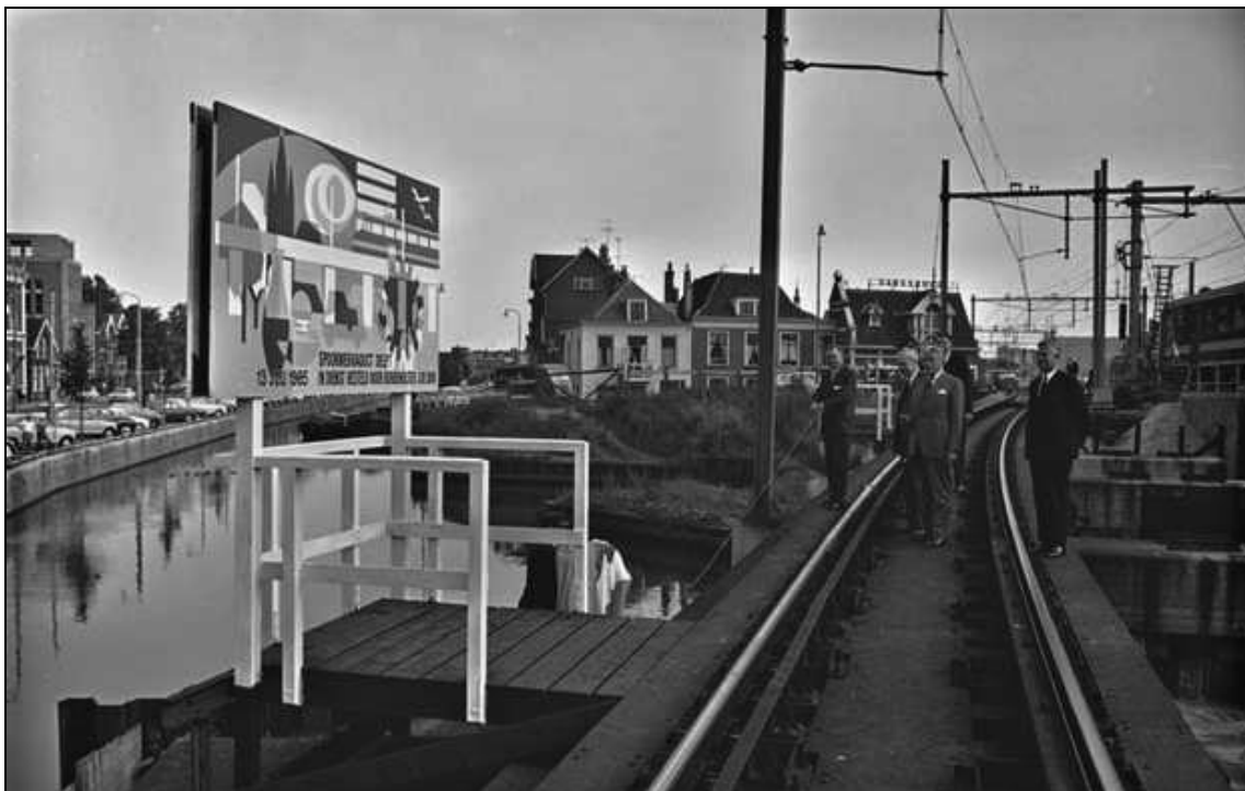
Opening van het spoorwegviaduct in 1965

Kaartverkoop via de webshop van www.werkplaatsspoorzonedelft.nl