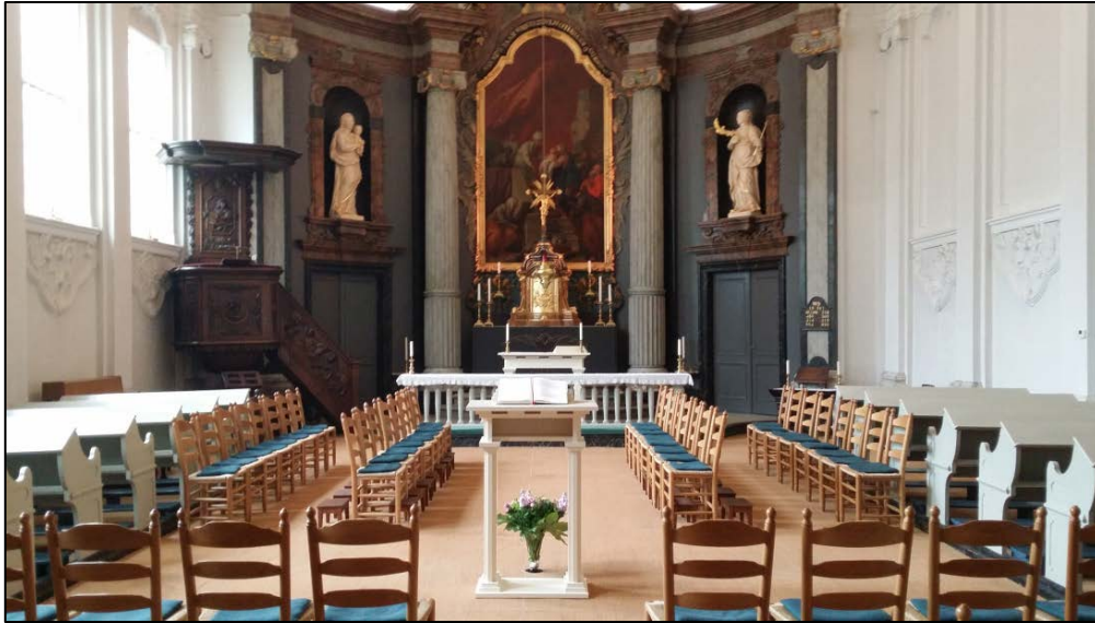
Interieur van de Delftse oud-katholieke kerk