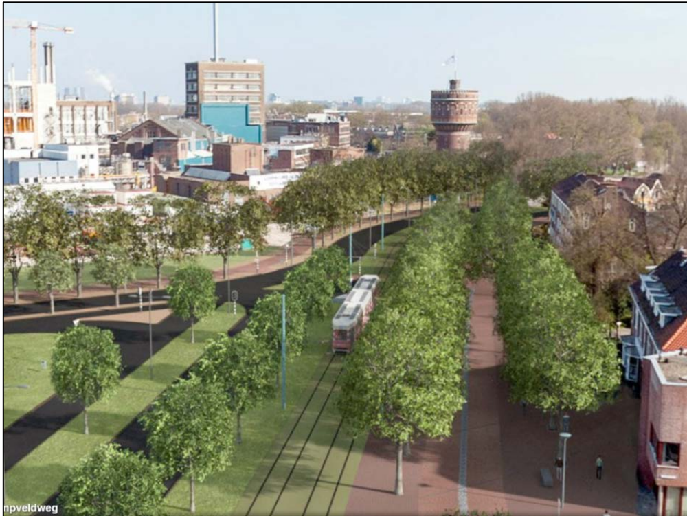
Helikopterview van de omgeving Kampveldweg en Wateringsevest, zoals ontworpen door Busquets.

bouwdrift. De Watertoren en zijn directe omgeving horen bij het Kalverbos en niet bij de openbare ruimte van de Spoorzone. Maar omdat het ene gebied hier op het andere aansluit, is de gedachte dat de inrichting van de Spoorzone als het ware nog een beetje wordt doorgetrokken. Dus ook hier een breder fietspad en een groenstrook tussen fietsers en auto's. Om dit allemaal te realiseren moeten de bomen bij de Watertoren verdwijnen. Precies dat is bij de Commissie Behoud Stadsschoon in het verkeerde keelgat geschoten. Een door CBS geraadpleegde bomenspecialist stelt dat juist deze bomen belangrijk zijn, omdat ze de parkrand accentueren. Kappen zou een verarming zijn voor het Kalverbos. Dit parkje is aangelegd in een laat 19 e eeuwse romantische stijl. Die zou versterkt moeten worden en niet moeten verrommelen.