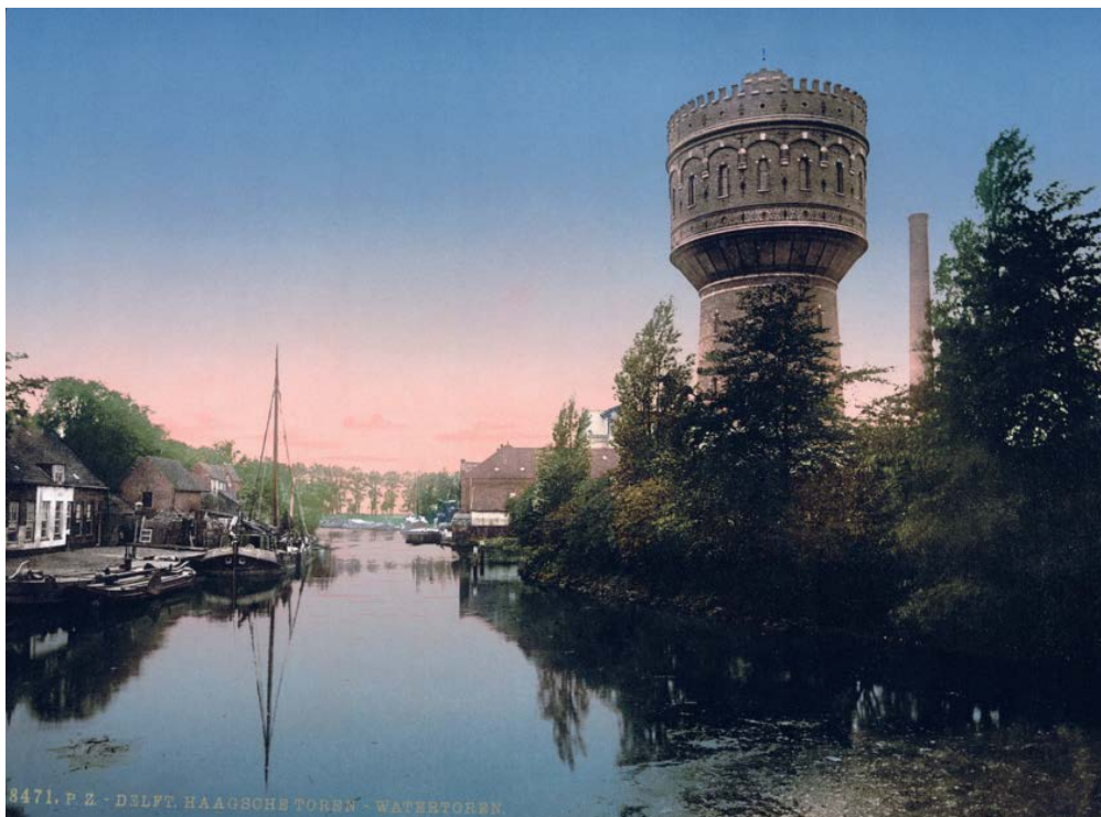
Zo groen was Delft rond 1910. Links de Wateringsevest, met huizen op de Vest die in 1925 werden gesloopt. Het water is de Singelgracht met rechts de Watertoren in het groen. In de verte een restant van een bolwerk.

Waarom is de Commissie Behoud Stadsschoon dan toch niet echt blij? De terug te planten bomen zijn een soort sigaar uit eigen doos geworden. Op een nieuwe ontwerp-tekening is te zien dat ze worden neergezet in het groenstrookje tussen fietspad en verkeersweg. Daar hadden tussen Kampveldweg en Watertoren die 26 bomen moeten komen, naar idee van Busquets. Dat aantal is nu teruggebracht naar 6, waarvan er twee als 'herplant' worden gekwalificeerd. Dat is toch een wat bizarre uitkomst. De te verwijderen bomen komen dus niet terug in het groen bij de Watertoren/Kalverbos, maar in een 'verkeersgroentje' tussen auto's en fietsers. Kan dat niet anders? Bomen in zulke groenstrookjes lijden vaak een kwijnend bestaan, omdat ze last hebben van verharding – asfalt of tegels – aan weerskanten en van het verkeer. Door het weglaten van de lange rij bomen lijkt het hele fabrieksterrein van DSM nu breed in beeld te komen, gezien vanaf de Wateringsevest. Wellicht kan DSM hier een mooie gracht graven. Met een doornhaag aan de kant van het eigen terrein. Dat geeft de fietsers een leuk uitzicht en houdt dieven weg. Intussen probeert CBS in gesprek te raken met betrokkenen. Want zo nonchalant als het nu gebeurt, kan er toch niet met groen worden omgesprongen.