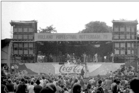
Holland Popfestival Kralingen in 1970

Deze avond zal in het teken staan van een veel recentere geschiedenis: die van MOJO-concerts en