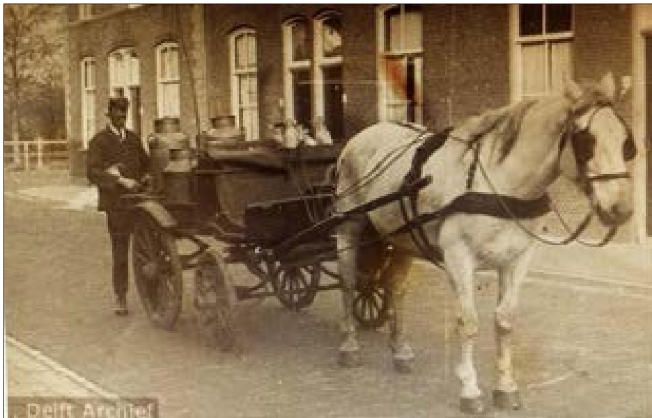
Melkboer Tetteroo bij Nieuwe Langedijk 59

Wie alvast wil kennis maken met het onderzoek dat tot nu toe is gedaan, kan rondsnuffelen op de website www.achterdegevelsvandelft.nl Daar zijn inmiddels weer twee nieuwe onderzoeks- onderwerpen geplaatst: Nieuwe Langendijk 59 , een voormalige stadsboerderij (onderzoek Kees van der Wiel) en Oosteinde 149 , lang geleden een herberg en later een winkel (onderzoek K. Langendijk). Inmiddels is ook het zoekstelsel van het HisGis (Historische Geografisch Informatie Systeem) weer (beperkt) bruikbaar en via internet bereikbaar: http://delft.maps.arcgis.com/apps/View/index.html?appid=16043cde237e437d80c8d627526f7431