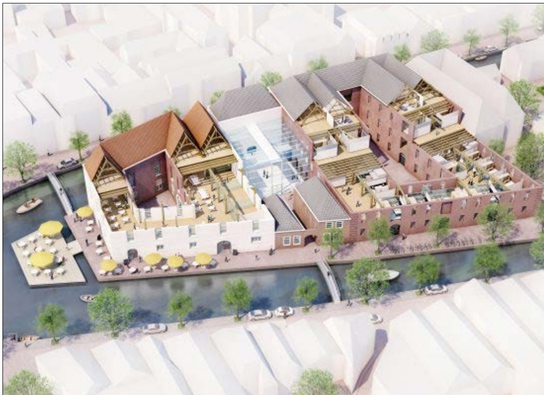
Herontwikkeling van het Armamentarium met nieuwe bruggen en terras

Het is kortom een deel van de oude binnenstad met een uitzonderlijk hoge kwaliteit. Vanwege de ruimtelijke beleving, het zicht op water en gebouw zoals het nu is, maar ook historisch gezien. CBS ziet nadrukkelijk ook het water als een historisch waardevol element dat moet worden veilig gesteld. Deze gedachte vloeit voort uit het feit dat de stad uit het water is 'voortgekomen'. Zonder de waterbeheersing zou zij niet kunnen bestaan.