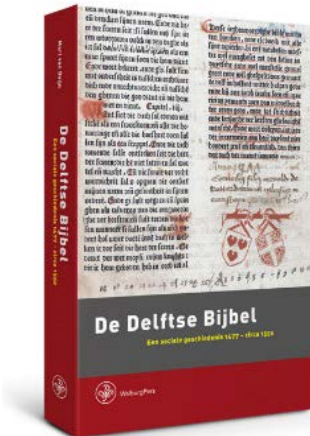
De Delftse Bijbel, uitgave de Walburg Pers 2017