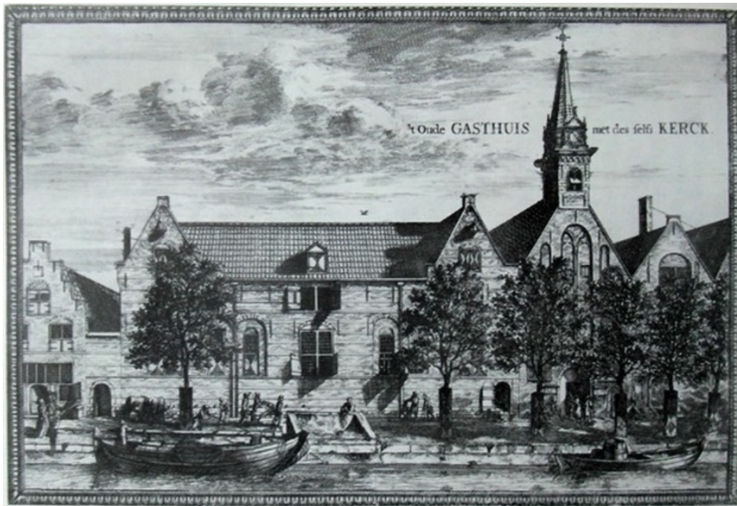
Het Oude Gasthuis aan de Koornmarkt, circa 1680

Op deze plek heeft ruim 700 jaar onafgebroken ziekenzorg plaatsgevonden. In 1968 vertrok het Oude en Nieuwe Gasthuis naar een locatie aan de Westlandseweg. Sindsdien zijn verschillende plannen ontwikkeld voor deze prominente historische plek in de binnenstad. Wellicht herinnert u zich de lezing van Delfia Batavorum hierover uit 2013. Deze plannen zijn geen van alle gerealiseerd. Het is nu vooral een parkeerplaats.