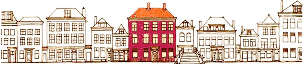
De Peereboom, Oude Delft 194