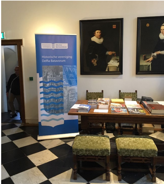
De stand in het stadhuis