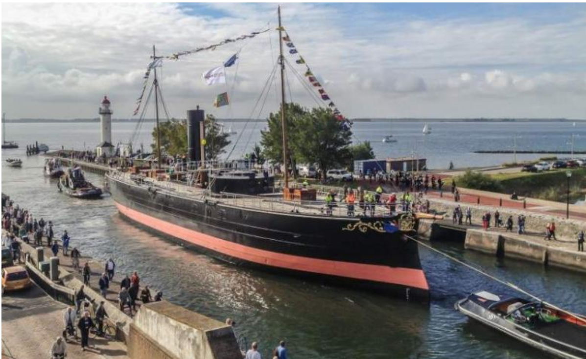
Museumschip De Buffel

Hellevoetsluis was vanaf het begin van de VOC-tijd eeuwenlang de belangrijkste haven van de Hollandse oorlogsvloot. Het was de thuishaven van De Ruyter, Tromp en Piet Heyn. In 1688 vertrok stadhouder Willem III met 400 schepen uit Hellevoetsluis naar Engeland om de koning te verjagen. In de haven, vlakbij het dok, ligt museumschip De Buffel. De Buffel werd in 1868 gebouwd en was één van de eerste stalen schepen, bedoeld als ramtoerschip ter verdediging van de Nederlandse kustwateren. Aan het einde van de binnenhaven ligt restaurant Fortezza in het oude pomphuis van het open droogdok Jan Blanken, al 200 jaar oud en nog altijd als droogdok in gebruik. Jan Blanken, waterbouwkundige, ontwierp het dok met een ondergronds systeem om water direct beschikbaar te hebben in geval van brand. Bij het werken met pek en vuur was dat niet denkbeeldig. Deze aquaducten liggen nu droog.